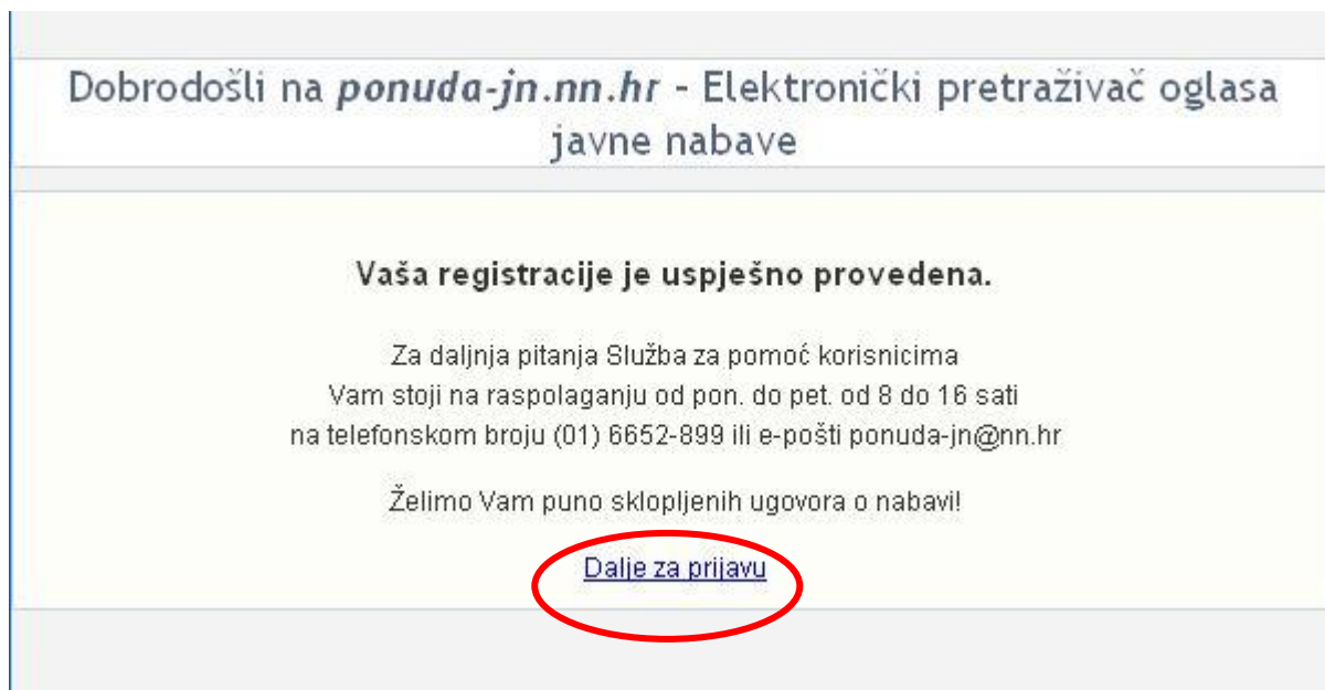
Slika 9. Informacija o uspješno napravljenoj prijavi

Klikom na link „Dalje za prijavu“ ponovno se otvara prozor za prijavu („login“). Nakon unosa podataka iz registracije, omogućava se otvaranje i preuzimanje dokumentacije za nadmetanje.